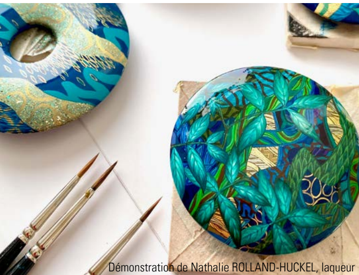
Démonstration de Nathalie ROLLAND-HUCKEL, laqueur

Et enfin, trois créateurs se prêtent à nouveau au jeu de la démonstration en direct , commentée et projetée sur grand écran, pour dévoiler les secrets de leur métier au grand public mais aussi répondre à leurs questions pour un moment convivial et intimiste.