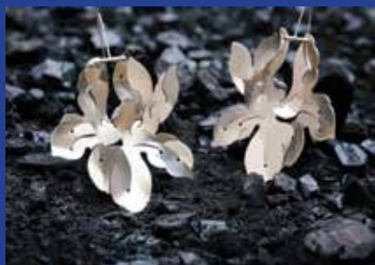
PETIT PALLAS, créatrice de bijoux