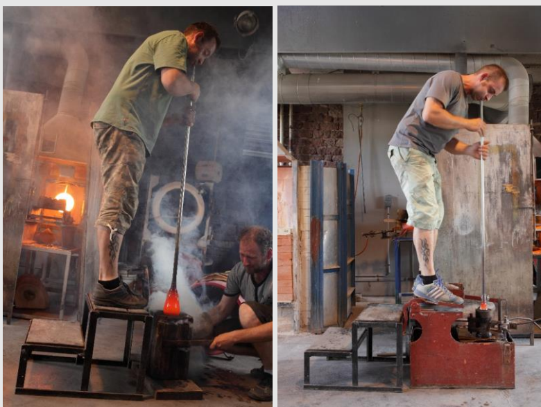
Ouverture manuelle et ouverture mécanique du moule – CIAV.

◇ Au moule. La paraison est enfermée dans un moule ; le verrier souffle alors dans la canne jusqu'à ce que le verre épouse parfaitement la forme du moule. L'ouverture du moule peut être effectuée à la main, par un aide, ou mécaniquement, en appuyant sur une pédale, si le verrier dispose d'un gamin mécanique.