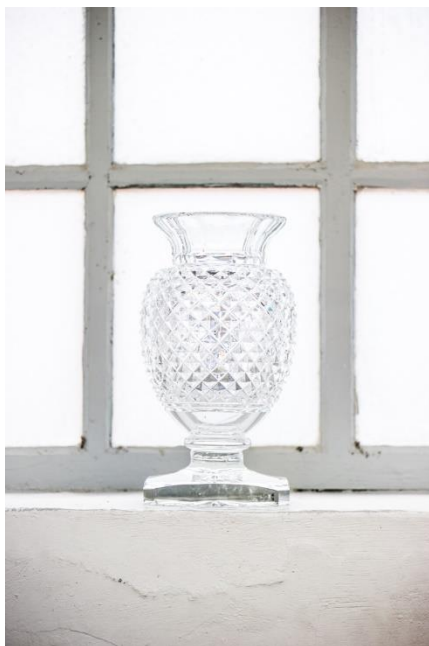
Vase en cristal. © Saint-Louis / Benoît Teillet.