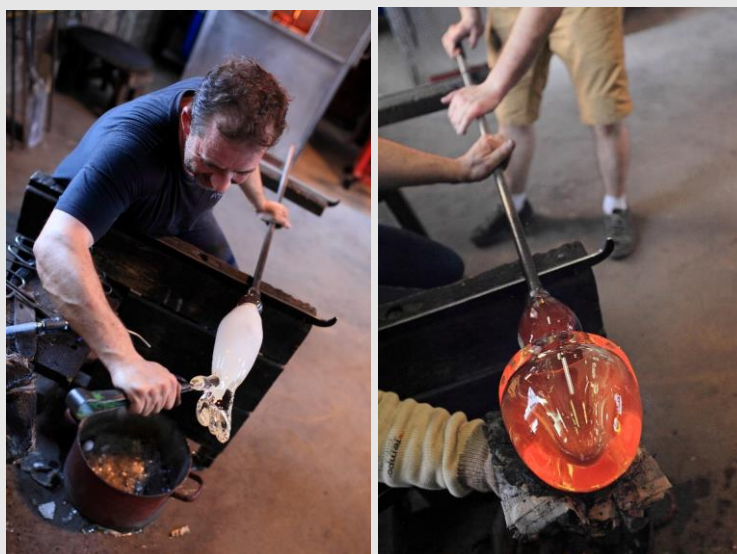
Mise en forme à l'aide d'une pince et à l'aide d'une « mouillette » – CIAV.