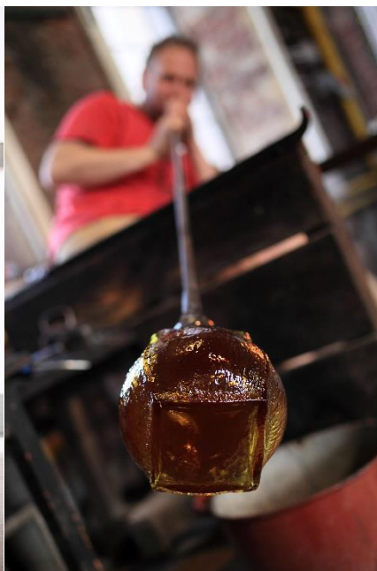
Souffleur de verre.