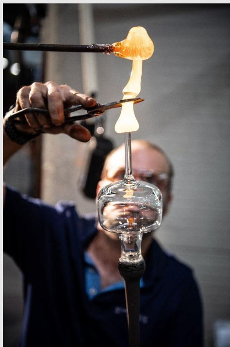
Pose d'un ajout.

— Les ajouts. Des ajouts peuvent être posés sur la pièce : pied, jambes, anse, bec... Le cueilleur apporte du verre en fusion avec un ferret. Le verrier coupe la quantité de matière qu'il juge nécessaire pour former un ajout et le souder au corps de la pièce.