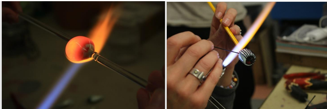
Verre filé au chalumeau.

— Le verre soufflé au chalumeau. Il est possible de fabriquer des contenants en verre de toutes les formes et de toutes les tailles à partir de tubes en verre. Le verrier détermine le diamètre du tube en fonction de la pièce qu'il souhaite réaliser. La partie du tube à dilater est d'abord chauffée, étirée, puis soufflée afin d'éviter que le tube s'aplatisse. La forme creuse est modelée par le mouvement que lui impriment les mains du verrier, mais aussi à l'aide de différents outils, pinces et ciseaux. Cette technique permet de réaliser des formes très complexes. Plusieurs parties peuvent être façonnées indépendamment les unes des autres puis assemblées dans un second temps. Il est également possible d'ajouter des ponts éphémères en verre aux objets en cours de fabrication afin de les saisir et de les faire tourner plus aisément.