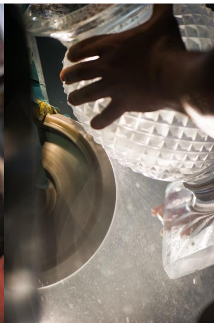
Taille de cristal.