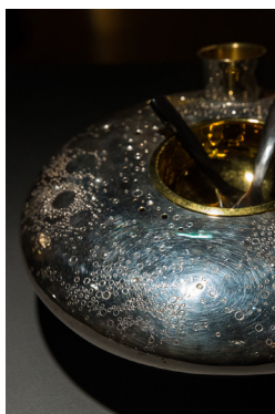
« Embarquement pour Cythère »