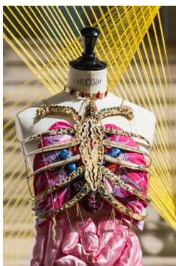
« Wear Your Body »