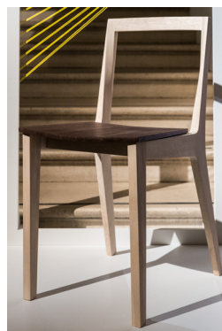
« La Petite Cognée »