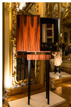
« Duetto »