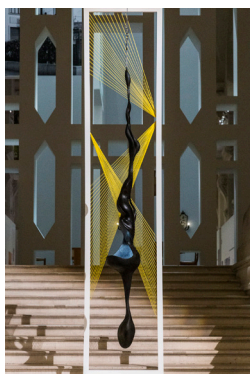
« Icare »