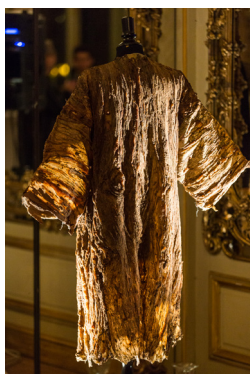
« Je m'habille en arbre »